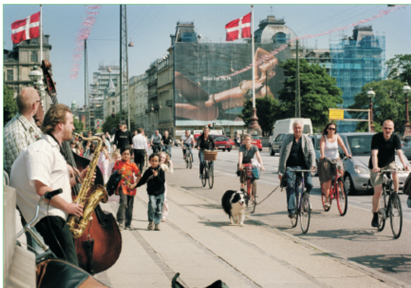
CO 2 -neutral transport