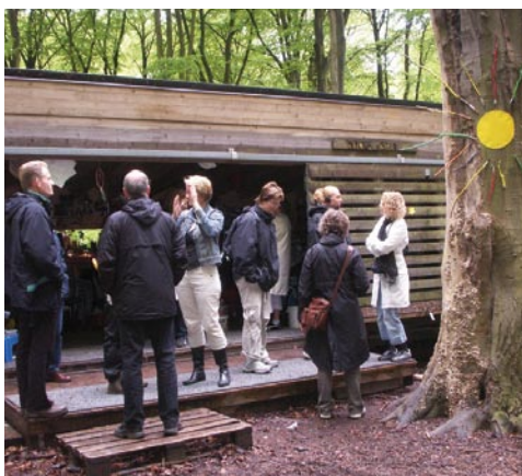
Pædagoger fra Ballerup, Albertslund og København