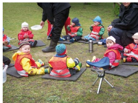
Børnene spiser deres varme mad udenfor. Hvert barn har siddeunderlag, og hver sin lille vanddunk.