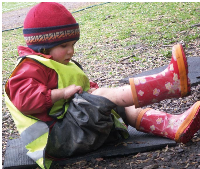
Der er ingen problemer med støj og larm - tinitus er et ukendt begreb i en naturbørnehave

Vi fortsætter gennem parken. Lidt efter går vi forbi et bord med legoklodser. Der sidder ingen børn ved bordet. Ellers består legepladsen af omgivelserne i parken - en stejl mudderbakke børnene kan rulle ned af, hytter af grene, bål og en masse store gamle bøgetræer.