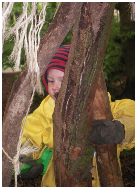
Børnene leger ude hele året

Undersøgelser dokumenterer, at børn i naturbørnehaver har færre sygedage, bedre motorik og koncentrationsevne end børn i traditionelle børnehaver.