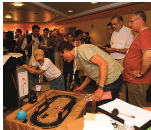
En hånddrevet racerbane var med til at lokke folk til Dogme-standen

Dogme 2000 havde i år en stand på udstillingen. Fokus var samarbejde mellem kommuner, og mange var forbi for at høre om, hvordan vi arbejder og hvad vi får ud af det.